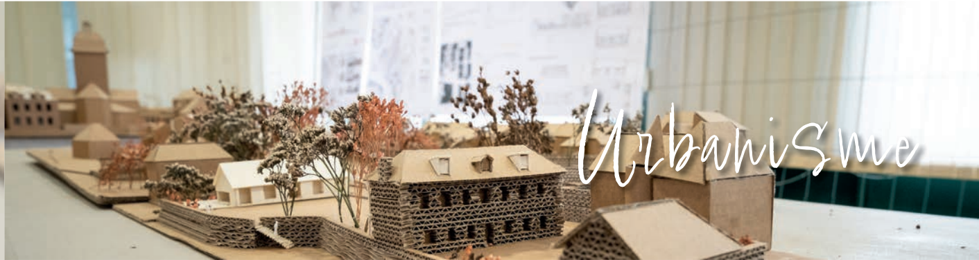
SCHÉMA DIRECTEUR CYCLABLE COMMUNAL

La municipalité souhaite porter une politique cyclable ambitieuse pour, à terme, mettre à disposition des habitants un réseau cyclable complet (photo de carte ci-dessous) reliant les quatre bourgs historiques, mais aussi les pôles d'attractivité et de services des communes voisines.